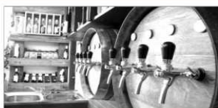
KARTA STÁLÉHO ZÁKAZNÍKA

zahajuje stáčení MORAVSKÝCH sudových vín. Přijďte a vyzkoušejte kvalitu našeho vína za výhodné ceny.