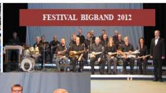
FESTIVAL BIGBAND 2012