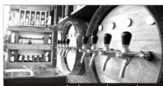
KARTA STÁLÉHO ZÁKAZNÍKA

zahajuje stáčení MORAVSKÝCH sudových vín. Přijďte a vyzkoušejte kvalitu našeho vína za výhodné ceny.