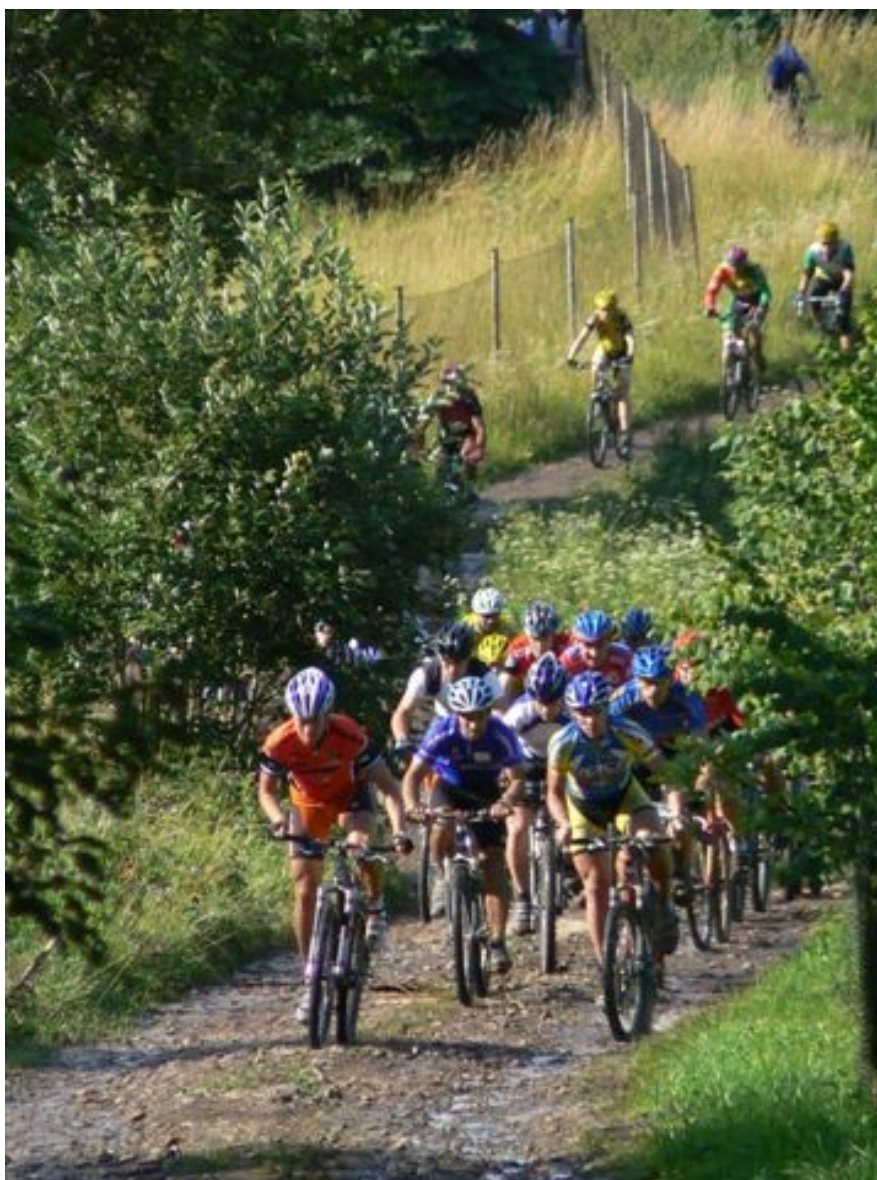
Závodníci na cestě k Boru

11. července 2007 se konal závod Střeční pohár horských kol Královéhradeckého kraje Machov – Bor , jeden ze čtyř závodů horských kol do vrchu pro sportovní a rekreační jezdce všech kategorií. Hromadný start se uskutečnil u fy Doldy a závodníci pokračovali na Bor pod vyhlídku po trati dlouhé 2 750 metrů s převýšením 220 metrů. Pořadatelem závodů byl SK Redpoint Teplice nad Metují a Tomáš Doležal Doldy Machov(?). Machov přivítal závodníky mokrým počasím, protože se okolo druhé hodiny odpolední přehnala průtrž mračen. Trať se tedy místy proměnila v blátivou klouzačku. Na start se postavilo 44 jezdců. Po startu se do čela dostala dvojice Sulzbacher a Žilák, která vcelku bez problémů v tomto pořadí projela cílem v čase 13:30,24 a 13:58,93.