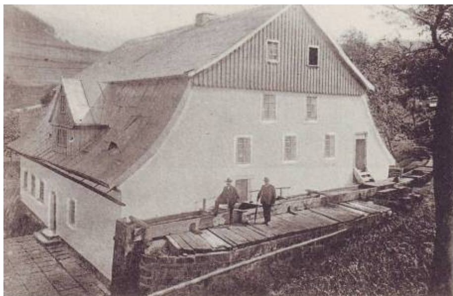
Mlýn před sto lety (1905)