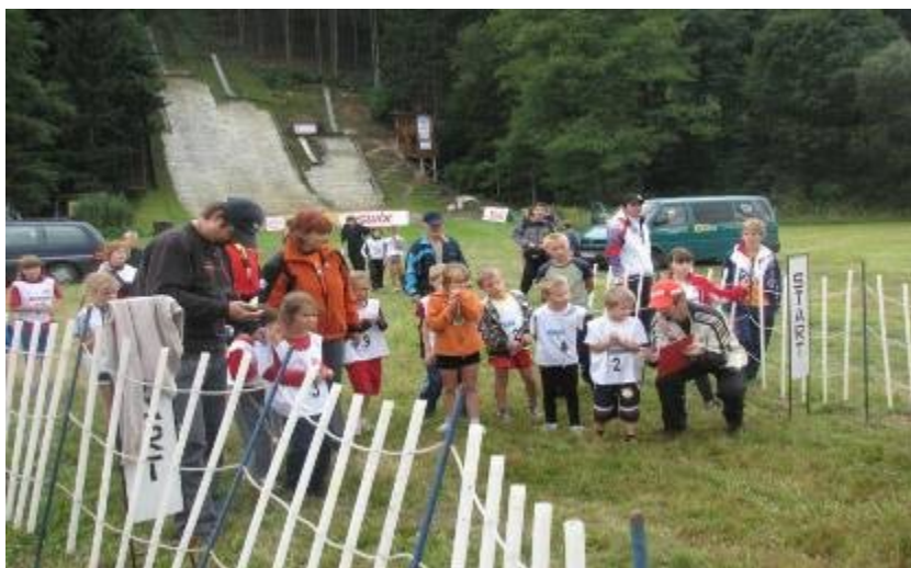
Nejmenší závodníci na startu běhu na 0,5 km.

Ve skokanském areálu byla dokončena výstavba nové věže rozhodčích. Na můstku K 24 byla položena nová nerezová nájezdová stopa a hrana, prodloužení nájezdu na K19 a nově vybudovaný přívod elektroinstalace do areálu.