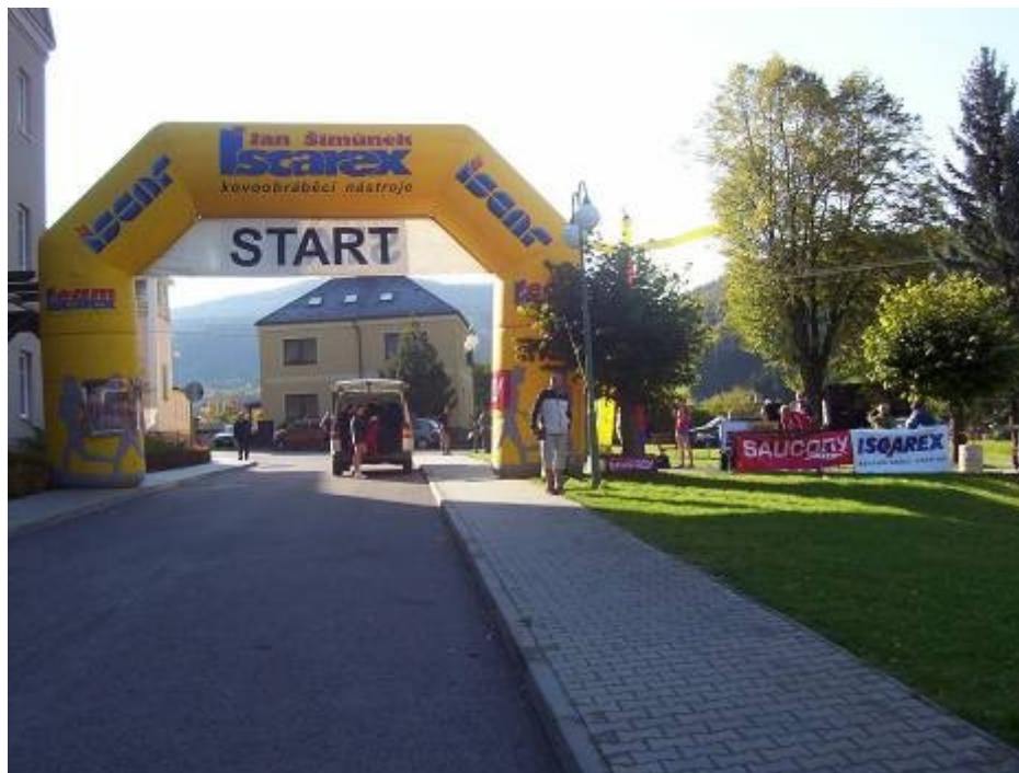
Startovní brána na náměstí

Eva Nývltová - 36:59,00 - rekordy nebyly překonány