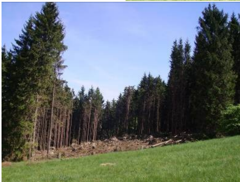
Následky vichřice na Bukovině