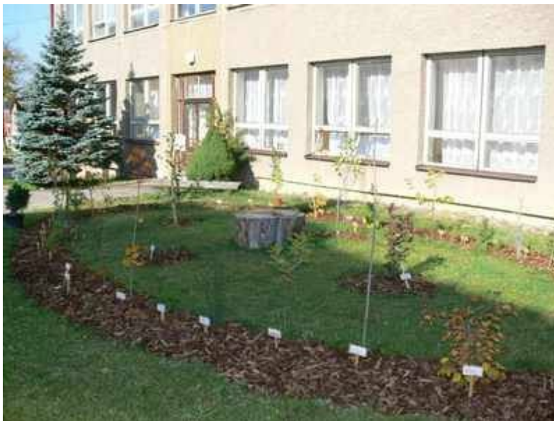
Keltský stromový kalendář u Základní školy

Pro zkrášlení okolí školy učitelé a žáci ZŠ Machov během prázdnin vybudovali před školou „ keltský stromový kalendář “. Vysázeli 40 různých stromů (22 druhů) do oválného záhonu (keltský kalendář přírodního času nerozděloval čas na týdny a měsíce, nýbrž na čtyřicet delších a kratších období, která odpovídala cyklům života a růstu stromů). Staří Keltové si všimli, že některé typy lidí odpovídají také svým charakterem určitému druhu stromů.